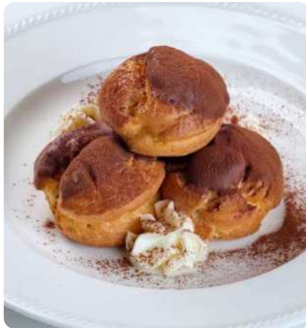
ПРОФИТРОЛИ С ШОКОЛАДНОЙ ГЛАЗУРЬЮ МОЛОЧНЫЙ ИЛИ ГОРЬКИЙ ШОКОЛАД НА ВЫБОР