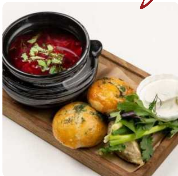
БОРЩ С ГОВЯДИНОЙ И ПАМПУШКАМИ