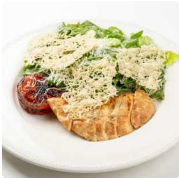
РОМАНО С КУРИЦЕЙ И ЧИПСАМИ ИЗ СЫРА ПАРМЕЗАН • 820