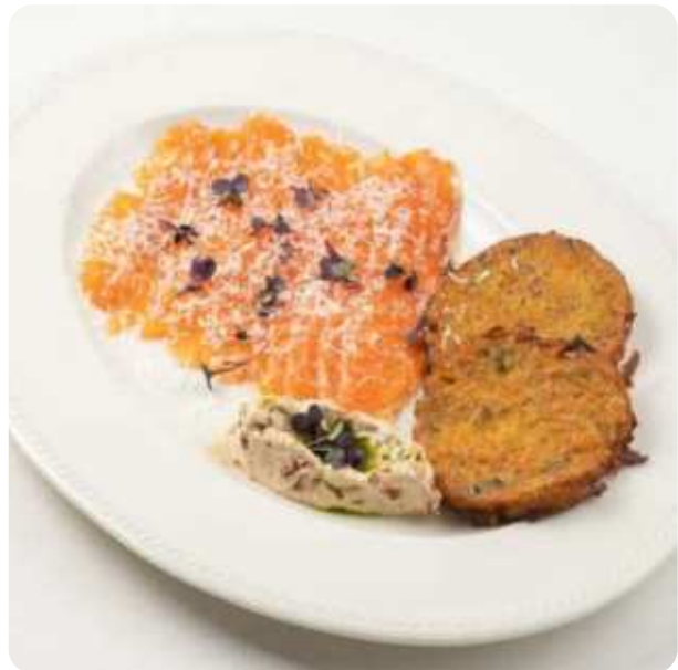
МАРИНОВАННАЯ ФОРЕЛЬ С ДРАНИКАМИ ИЗ БАТАТА И СЛИВОЧНЫМ КРЕМОМ • 1380

ПОЖАЛУЙСТА, СООБЩИТЕ ОФИЦИАНТУ, ЕСЛИ У ВАС ЕСТЬ АЛЛЕРГИЯ НА КАКИЕ-ЛИБО ПРОДУКТЫ