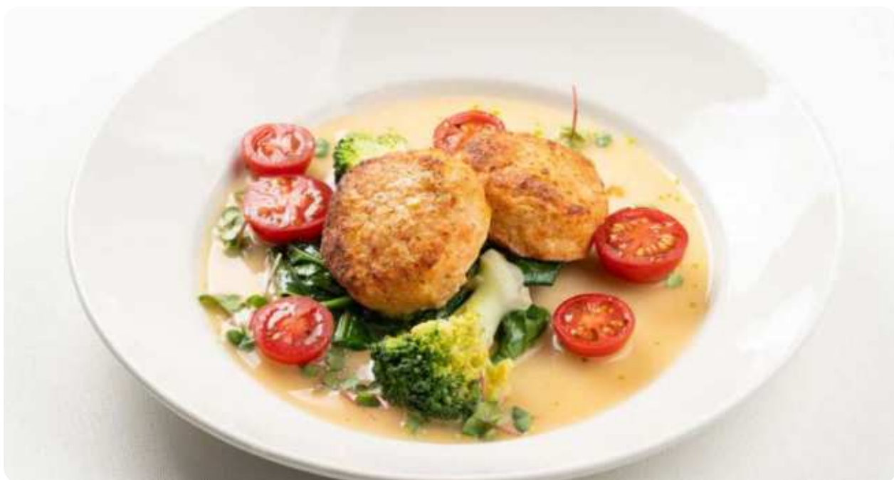
КРАБОВЫЕ КОТЛЕТЫ СО ШПИНАТОМ И ТОМАТАМИ • 1420

ПОЖАЛУЙСТА, СООБЩИТЕ ОФИЦИАНТУ, ЕСЛИ У ВАС ЕСТЬ АЛЛЕРГИЯ НА КАКИЕ-ЛИБО ПРОДУКТЫ