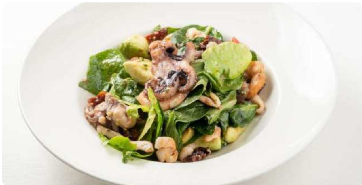
САЛАТ С МОРЕПРОДУКТАМИ