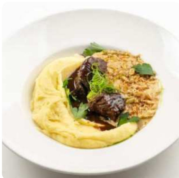
ТОМЛЁНЫЕ ЩЕЧКИ С КАРТОФЕЛЬНЫМ ПЮРЕ И МУССОМ ИЗ БЕЛЫХ ГРИБОВ • 1250