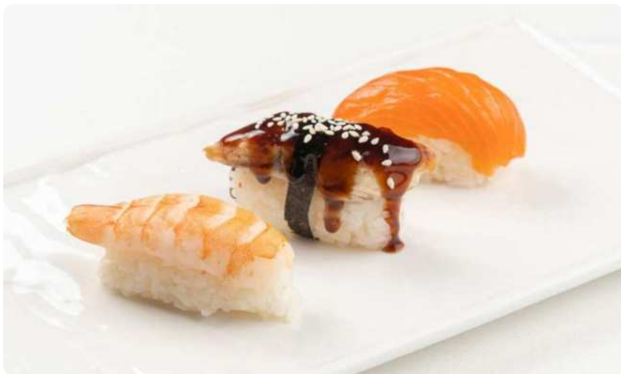
СУШИ КРЕВЕТКА, УГОРЬ, ЛОСОСЬ • 190

ПОЖАЛУЙСТА, СООБЩИТЕ ОФИЦИАНТУ, ЕСЛИ У ВАС ЕСТЬ АЛЛЕРГИЯ НА КАКИЕ-ЛИБО ПРОДУКТЫ