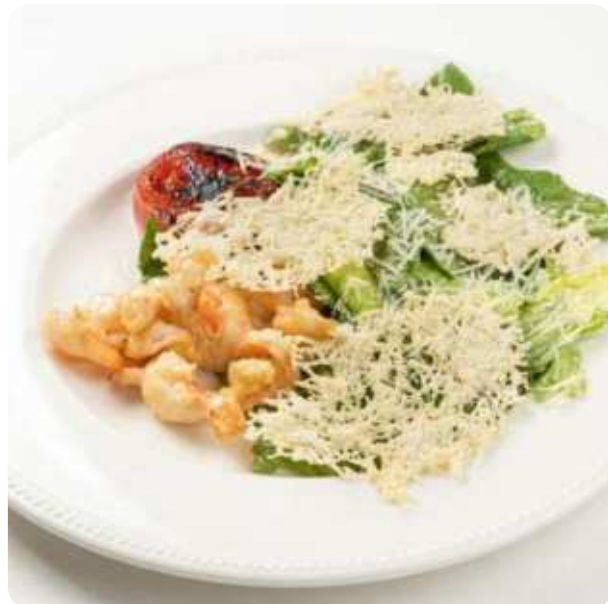
РОМАНО С КРЕВЕТКАМИ И ЧИПСАМИ ИЗ СЫРА ПАРМЕЗАН • 980