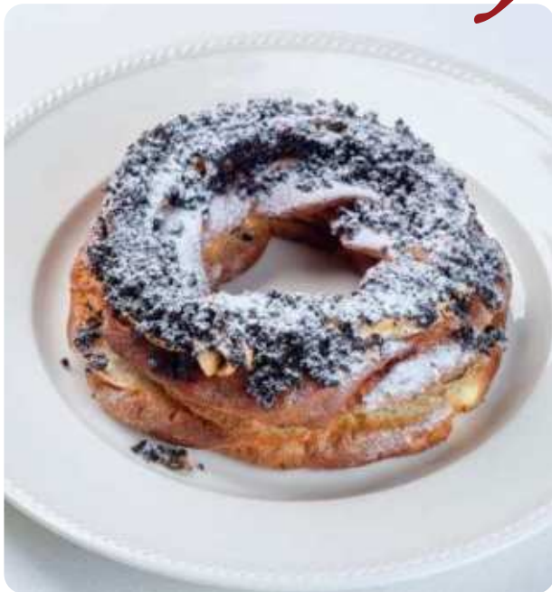
МАКОВОЕ КОЛЬЦО С ВАРЁНОЙ СГУЩЁНКОЙ