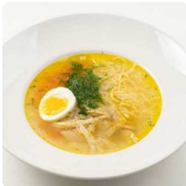
БУЛЬОН ИЗ ДОМАШНЕЙ КУРИЦЫ С ЯИЧНОЙ ЛАПШОЙ