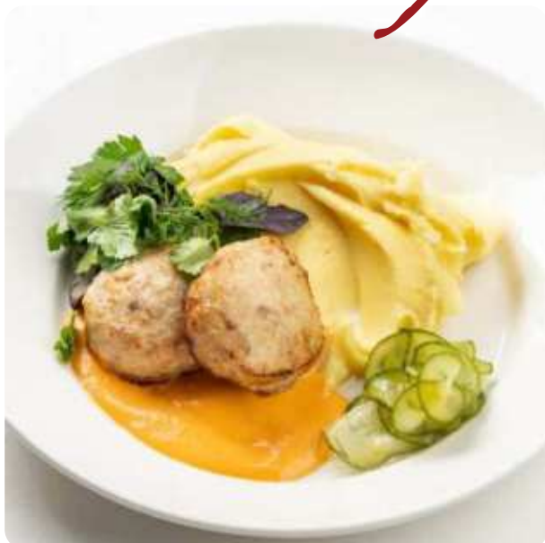
КУРИНЫЕ КОТЛЕТКИ С КАРТОФЕЛЬНЫМ ПЮРЕ И МАРИНОВАННЫМИ ОГУРЧИКАМИ • 750