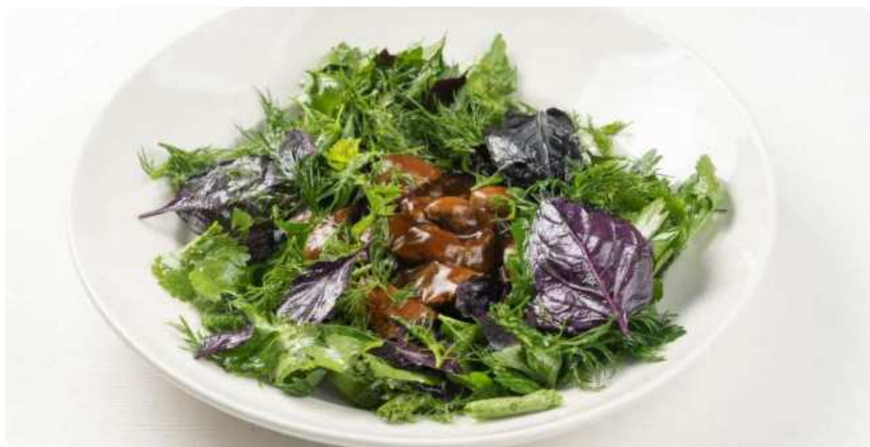
САЛАТ С ПЕЧЕНЬЮ КРОЛИКА И МИКСОМ ЗЕЛЕНИ