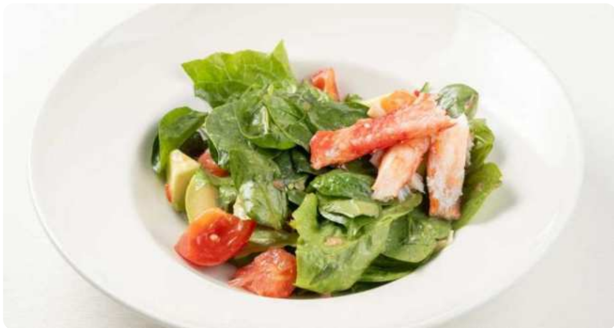
САЛАТ С КРАБОМ, АВОКАДО, ТОМАТАМИ И ГРЕЙПФРУТОМ • 1280

ПОЖАЛУЙСТА, СООБЩИТЕ ОФИЦИАНТУ, ЕСЛИ У ВАС ЕСТЬ АЛЛЕРГИЯ НА КАКИЕ-ЛИБО ПРОДУКТЫ