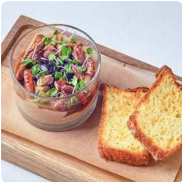
ПАШТЕТ ИЗ ФУАГРА И КУРИНОЙ ПЕЧЕНИ С ПОПКОРНОМ ПЕКАН • 880