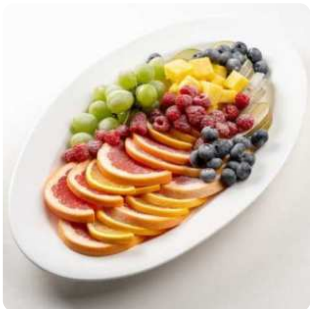
БОЛЬШОЕ ФРУКТОВОЕ ПЛАТО ВИНОГРАД, АНАНАС, АПЕЛЬСИН, ГРЕЙПФРУТ, ГРУША, МАЛИНА, ГОЛУБИКА