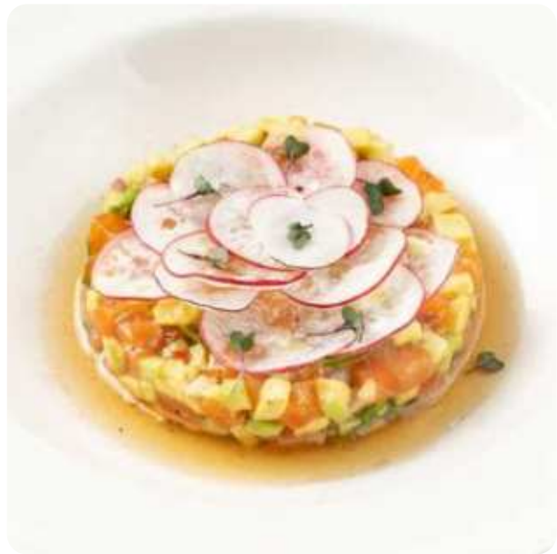
ТАРТАР ИЗ ЛОСОСЯ • 990