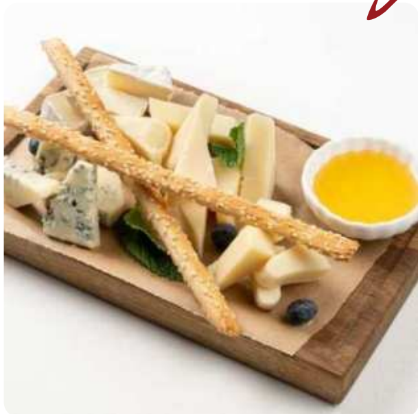
СЫРНОЕ ПЛАТО ГОРГОНЗОЛА, КАМАМБЕР, СЫРЫ ДЮРР РАЗНОЙ СТЕПЕНИ ВЫДЕРЖКИ