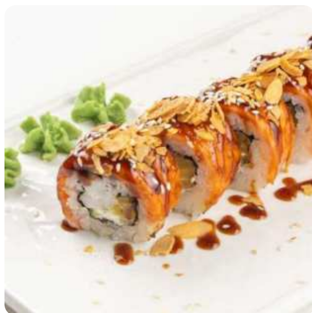
РОЛЛ С ОБОЖЖЕННЫМ ЛОСОСЕМ • 990

ПОЖАЛУЙСТА, СООБЩИТЕ ОФИЦИАНТУ, ЕСЛИ У ВАС ЕСТЬ АЛЛЕРГИЯ НА КАКИЕ-ЛИБО ПРОДУКТЫ