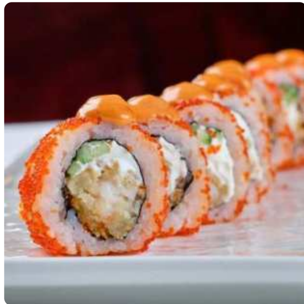
РОЛЛ С КРЕВЕТКАМИ ТЕМПУРА • 750