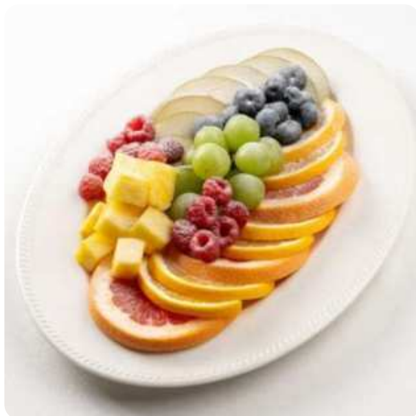
МАЛОЕ ФРУКТОВОЕ ПЛАТО ВИНОГРАД, АНАНАС, АПЕЛЬСИН, ГРЕЙПФРУТ, ГРУША, МАЛИНА, ГОЛУБИКА