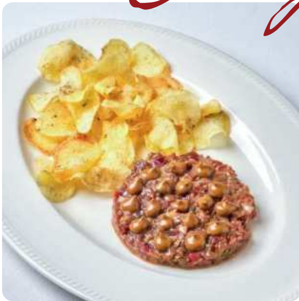
ТАРТАР ИЗ ГОВЯДИНЫ • 880