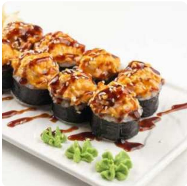
ЗАПЕЧЕННЫЙ РОЛЛ С КРЕВЕТКОЙ • 990