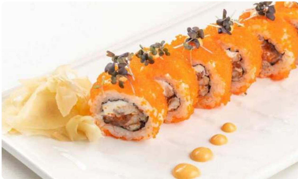
КАТАНА • 990