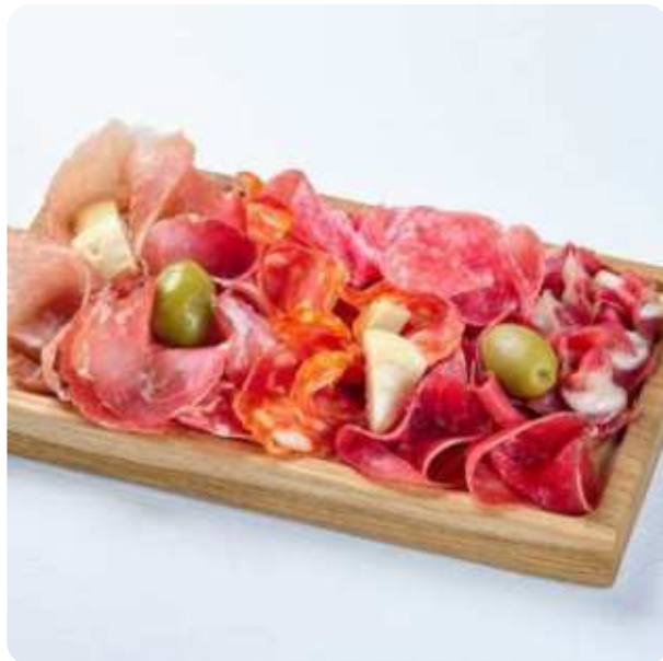
МЯСНОЕ ПЛАТО БРЕЗАОЛА, СЫРОКОПЧЁНАЯ УТКА, ПРОШУТТО КРУДО, САЛЯМИ МИЛАНО, ЧОРИЗО, КОППА