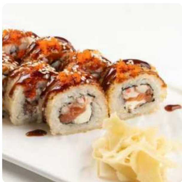
ТЁПЛЫЙ РОЛЛ «БАРХАТ» • 990