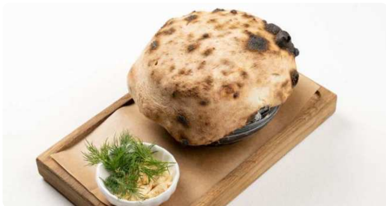
СЛИВОЧНАЯ УХА С СЕМГОЙ И ТРЕСКОЙ