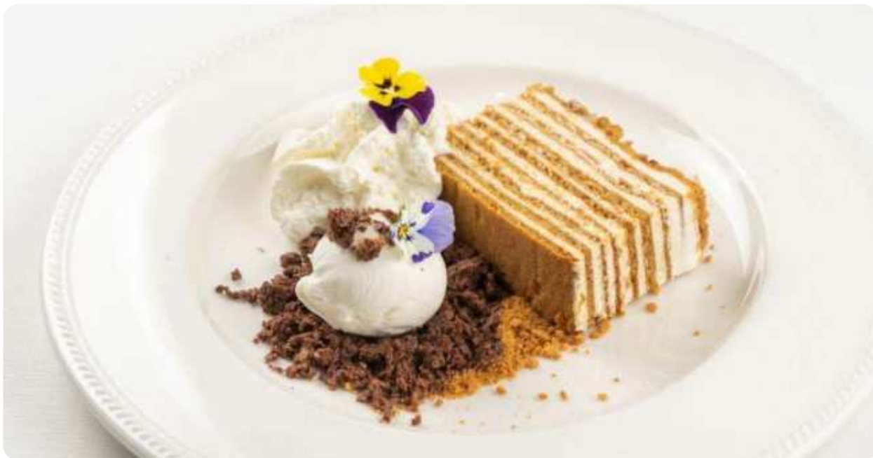
МЕДОВИК С ЭСПУМОЙ И МОРОЖЕНЫМ